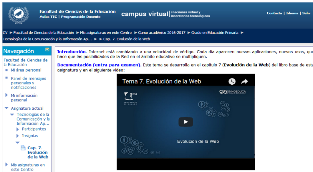
Ilustración 1: Campus Virtual

Nuestros alumnos debían ver, antes de cada clase, el/los vídeos correspondientes a cada tema y estudiar la documentación de cada uno.