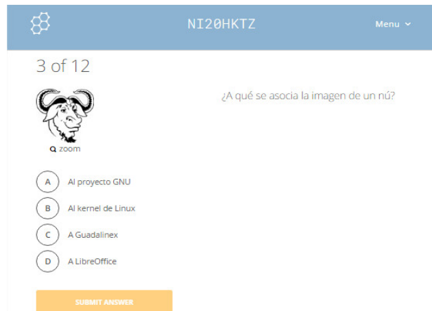
Ilustración 3: Cuestionario hecho en Socrative